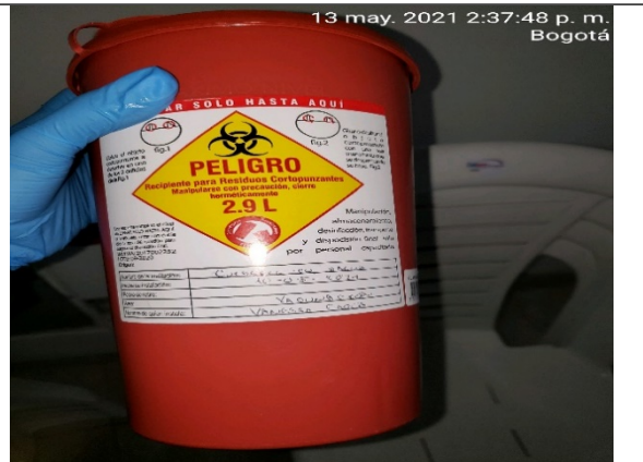
Foto 2: Guardián de residuos infecciosos (cortopunzantes) que refiere como generador al establecimiento CUIDARTE TU SALUD S.A.S. y fecha de generación el 10/05/21.