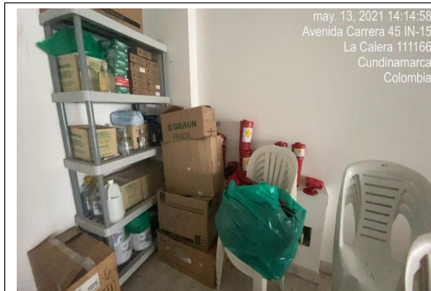
Foto 1: Área de bodega, acopio de contenedores, mobiliario y guardianes de residuos infecciosos cortopunzantes.